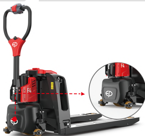
サブキャスター標準装備